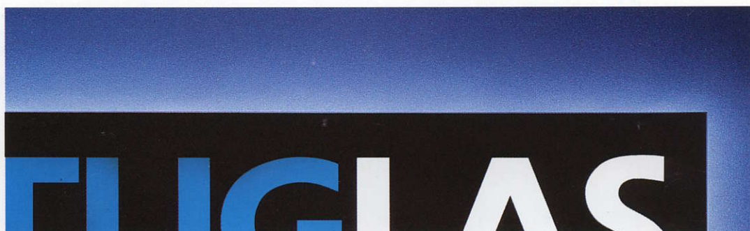
PLAQUE COULÉE TRANSLUCIDE ÉCLAIRÉE