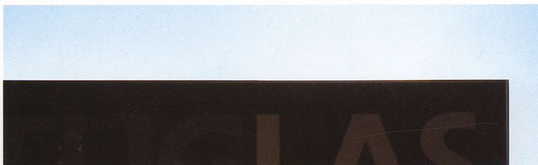
PLAQUE COULÉE TRANSLUCIDE NON ÉCLAIRÉE