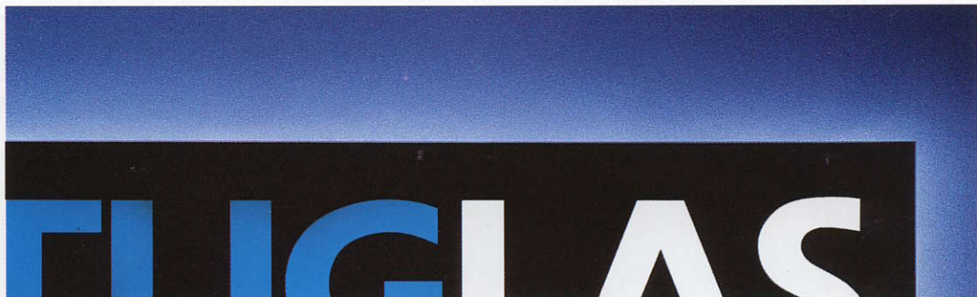
PLAQUE COULÉE TRANSLUCIDE ÉCLAIRÉE